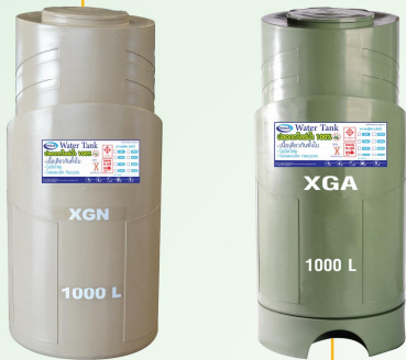
ที่ระบายนํ้าก็งอกันกัน สามารถระบายนํ้าทิ้งและตะกอนได้หมดเกลี้ยง

ปากถังลาดเอียงทำให้น้ำไม่ขัง ฟาแบบล๊อคปิดสนิทป้องกันมดและแมลงเข้าถัง ปากถังกว้างติดตั้งลูกลอยได้ง่าย