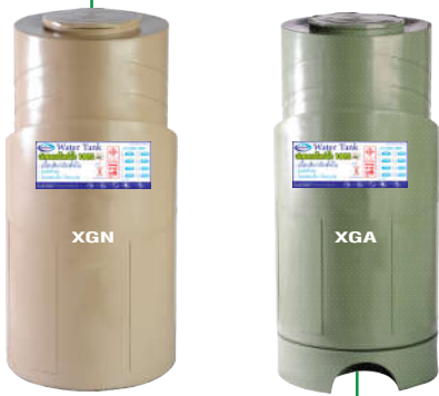
ท่อระบายน้ำตั้งอยู่กันถัง สามารถระบายน้ำทิ้งและตะกอนได้หมดเกลี้ยง

ฝาถังลาดเอียงทำให้น้ำไม่ขัง ฝาแบบล็อกปิดสนิทป้องกันมดและแมลงเข้าถัง ปากถังกว้างติดตั้งลูกลอยได้ง่าย