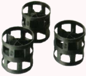
P-102 Random Flow Media